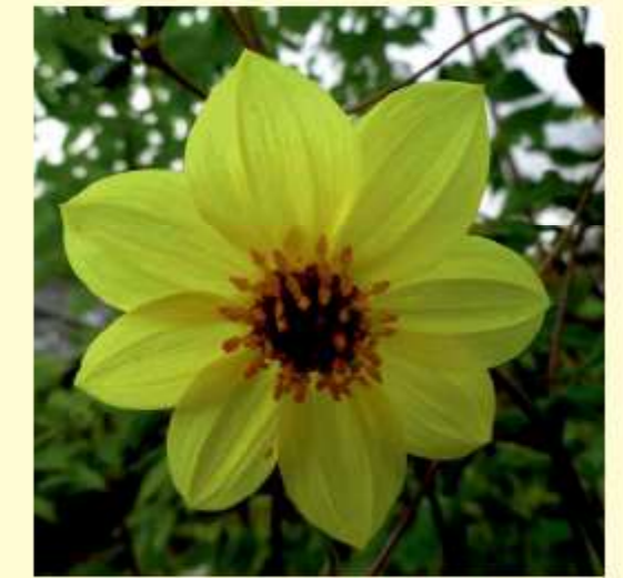
Dahlia tenuis Robinson & Greenham