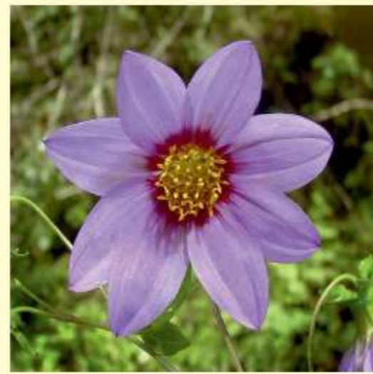
Dahlia tenuicaulis P.D. Sørensen