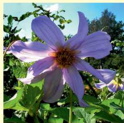
Dahlia spectabilis Sørensen / Hjerding / Saar