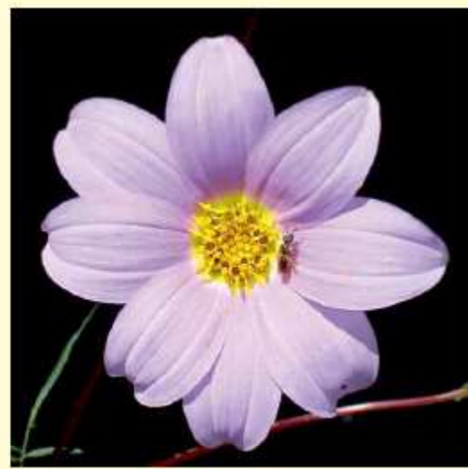
Dahlia foeniculifolia Sherff