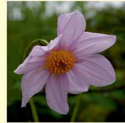
Dahlia pteropoda Sherff