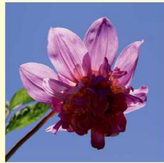
Dahlia excelsa Bent. ... ein Natur-Hybrid ?