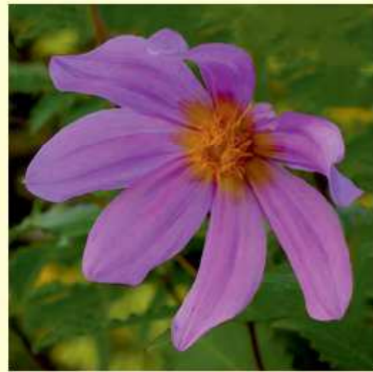
Dahlia sorensenii