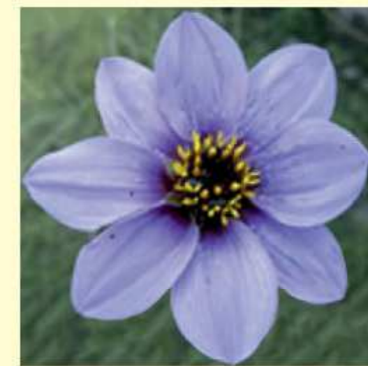
Dahlia congestifolia Foto: Aarón Rodríguez P.D. Sørensen