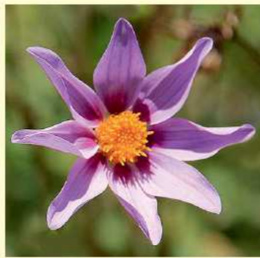
Dahlia rupicola P.D. Sørensen