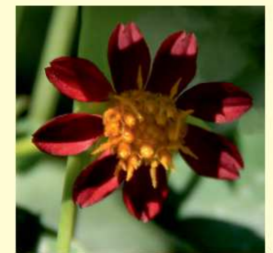
Dahlia cordifolia McVaugh (Sessé et Moc.)