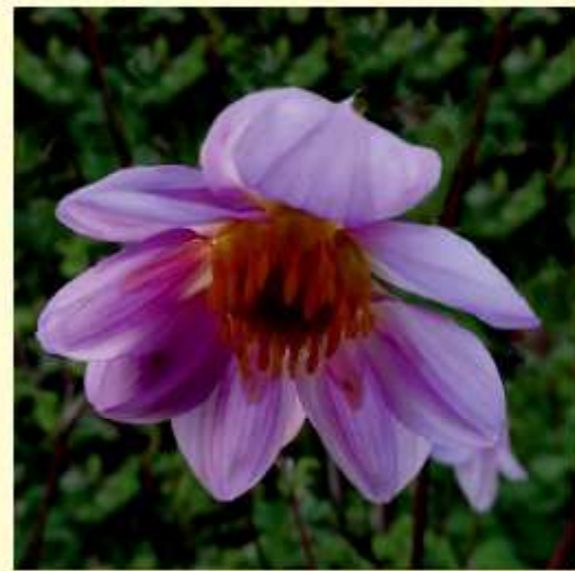
Dahlia mollis P.D. Sørensen