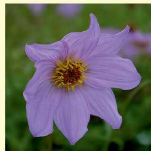
Dahlia brevis P.D. Sørensen