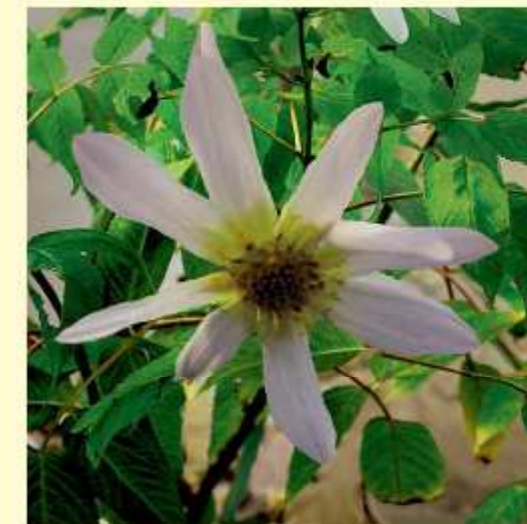
Dahlia macdougalii Sherff