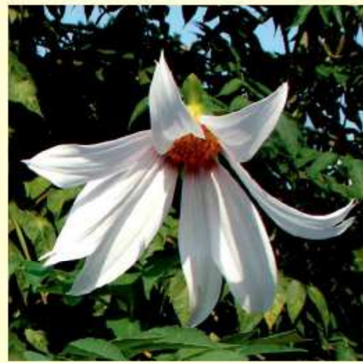
Dahlia campanulata D.E. Saar / P.D. Sørensen