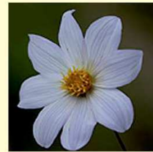
Dahlia dissecta S. Watson