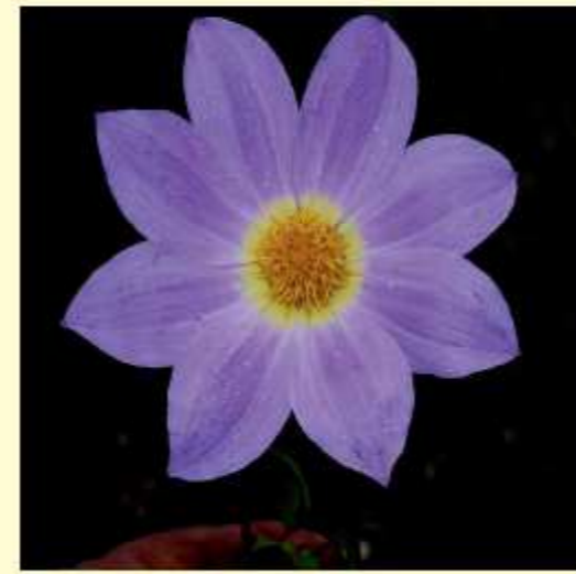
Dahlia apiculata Sherff / Sørensen