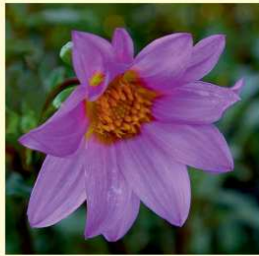
Dahlia tubulata P.D. Sørensen