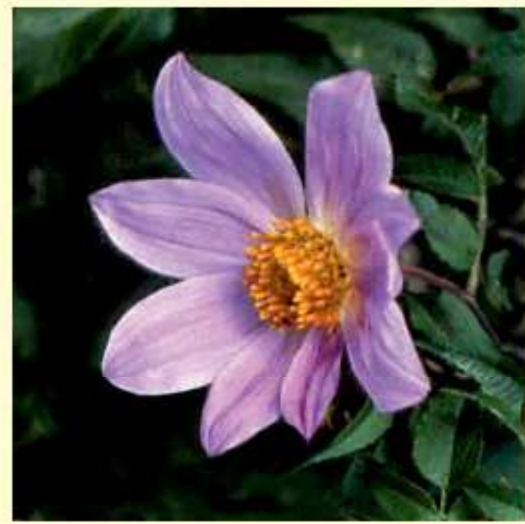
Dahlia imperialis B. Roez l ex E. Ortgies