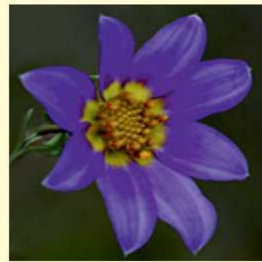
Dahlia linearis Sherff