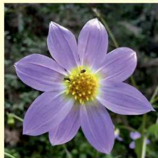
Dahlia tamaulipana J. Reyes Sektion IV Islas & Art. Castro