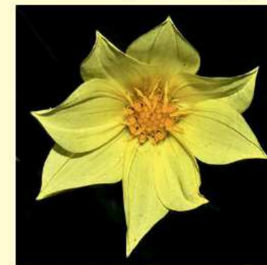
Dahlia mixteca J. Reyes, Sektion III Islas & Art. Castro