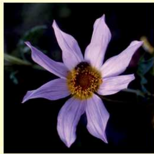
Dahlia scapigeroides Sherff