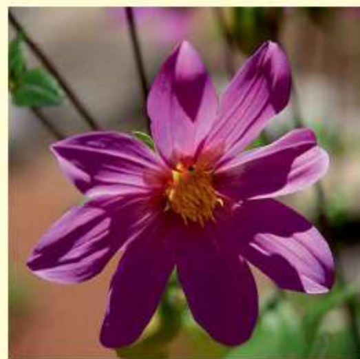
Dahlia cuspidata Sørensen / Hjerding / Saar