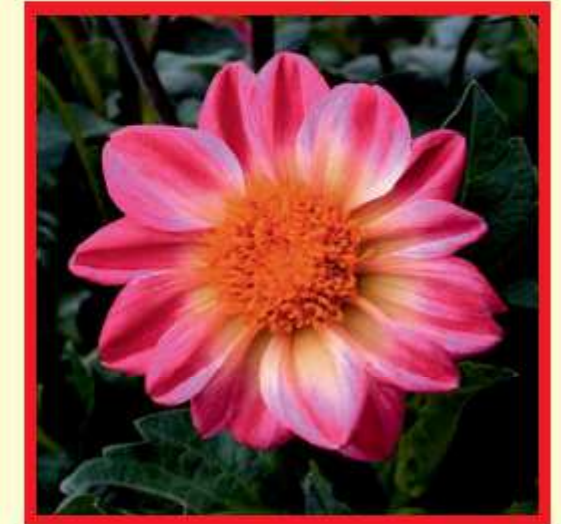
Dahlia pinnata Cav. Erstbeschreibung 1791 - J. A. Cavanilles