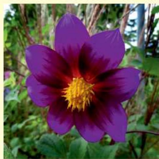
D. atropurpurea P.D. Sørensen