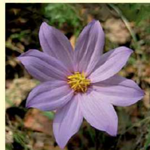
Dahlia pugana Aarón Rodr. Sektion IV & Art. Castro