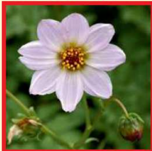
Dahlia merckii Lehm.

(sowie: Dahlia calzadana , Dahlia gypsicola , Dahlia pachyphylla )