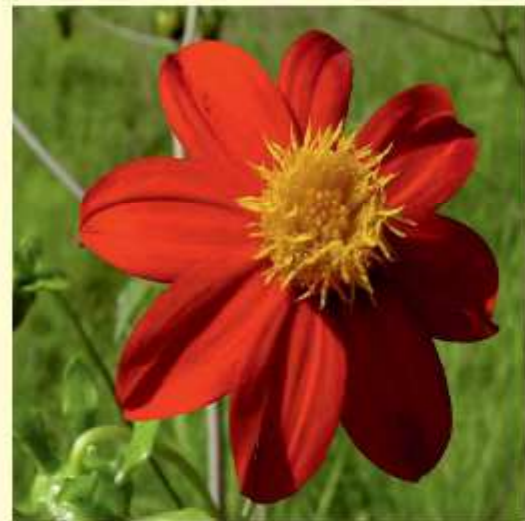
Dahlia coccinea Cav. Farbe: von zitronengelb bis tiefrot