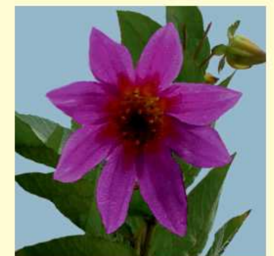
Dahlia purpusii Brandegee