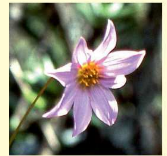
Dahlia subnigrosa Sørensen