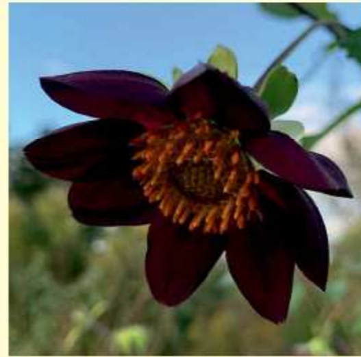
Dahlia hintonii Sherff