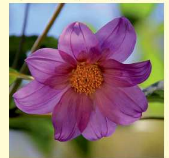
Dahlia oaxacana xxx Sektion IV

Zur Beachtung! Mehrere Arten variieren in Farbe und Form, z. B. die D. coccinea , D. merckii ... u.a. Hier sind typische Varianten dargestellt.