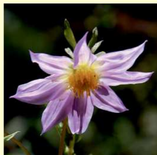
Dahlia neglecta Sørensen / Hjerding / Saar