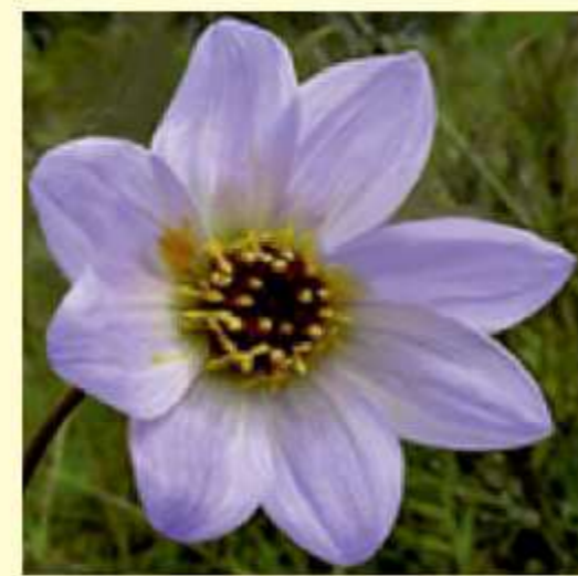
Dahlia scapigera A. Dietr. / Knowles & Westc.