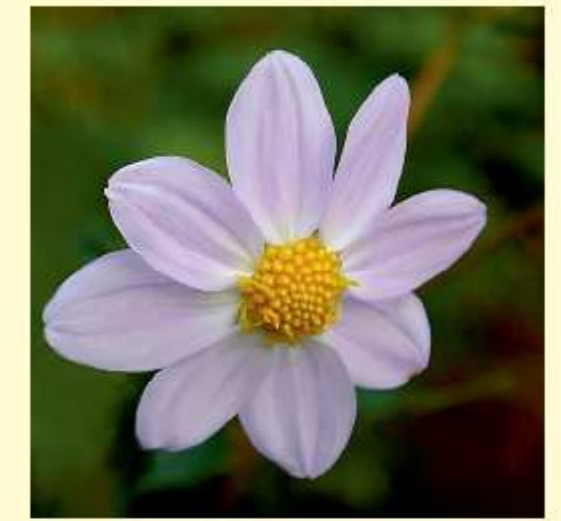
Dahlia parvibracteata Sørensen / Hjerding / Saar