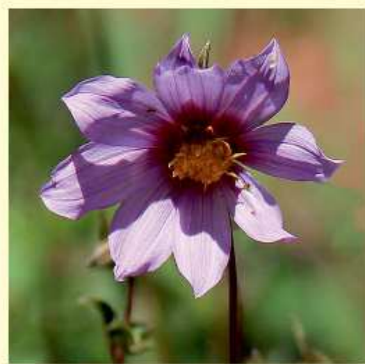
D. australis Sherff / Sørensen