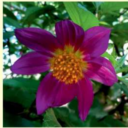
Dahlia rudis P.D. Sørensen