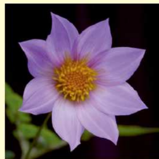
Dahlia barkeriae Knowles & Westc.